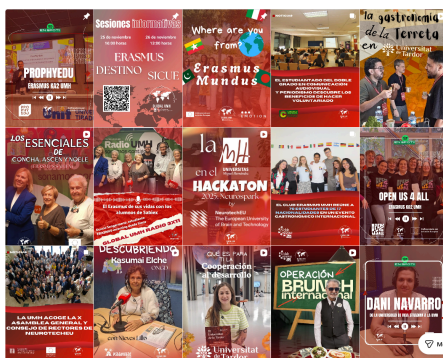
Perfil de Instagram: GlobalUMH

De igual forma, se mantiene la actualización diaria de la página web, con contenidos tanto del Servicio como del Vicerrectorado de Internacionalización y Cooperación, con espacios web específicos para las cátedras asociadas, especialmente el de la cátedra Sede Ruanda, así como el sitio web integrado para ofrecer toda la información sobre Neurotech y rankings.