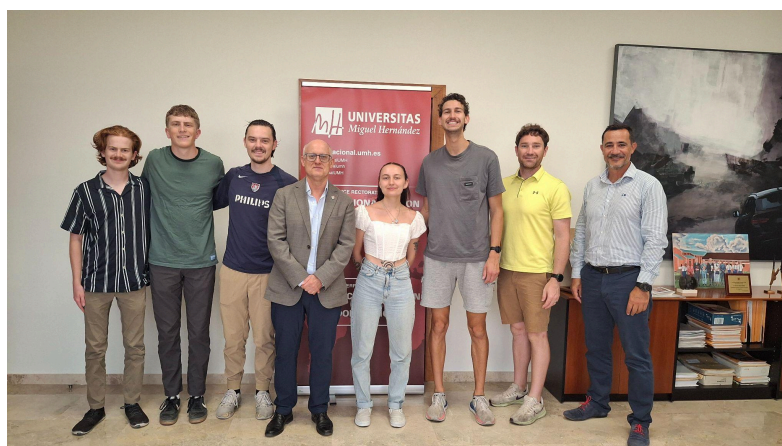
El estudiantado de Utah Tech en el Study Abroad STEM